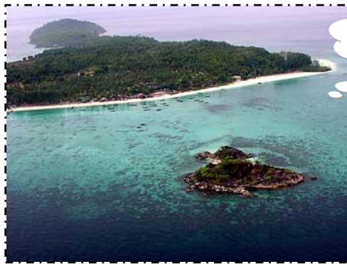
เกาะตะรุเตา