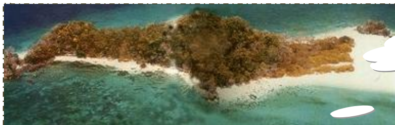
อุทยานแห่งชาติทะเลบัน

ตั้งอยู่ ต.วังประจัน อ.ควนโดน ที่มาชื่อ “ทะเลบัน” เป็นชื่อหนองที่เพี้ยนมาจากภาษามลายูว่า “เล็ดเรอบัน” มีความหมายว่าทะเลยุบ เป็นพื้นที่ป่าทางด้านทิศใต้ของจังหวัดสตูล ได้รับประกาศเป็นอุทยานเมื่อ พ.ศ. ๒๕๒๓ เพื่ออนุรักษ์ทรัพยากรป่าไม้และสัตว์ป่า ด้วยพื้นที่ป่าที่มีความสวยงาม มีภูเขาสลับซับซ้อน มีน้ำตก ถ้ำ มีหนองน้ำจืดขนาดใหญ่ที่มีน้ำขังตลอดปี ซึ่งเป็นแหล่งต้นน้ำลำธารของแม่น้ำและลำคลองต่างๆ