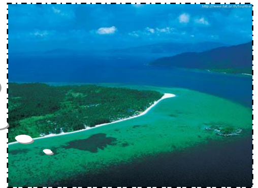
เกาะหลีเป๊ะ

เป็นเกาะที่ใหญ่ที่สุด เป็นที่ตั้งอุทยานและที่สำคัญทางประวัติศาสตร์ เพราะเคยเป็นที่กักกันนักโทษ เมื่อปี พ.ศ.๒๔๘๒ บริเวณเกาะประกอบไปด้วย ศูนย์บริการนักท่องเที่ยวหาดทรายที่สวยงาม ถ้ำจระเข้ หน้าผาโต๊ะบ จดชมวิวที่สวยงาม